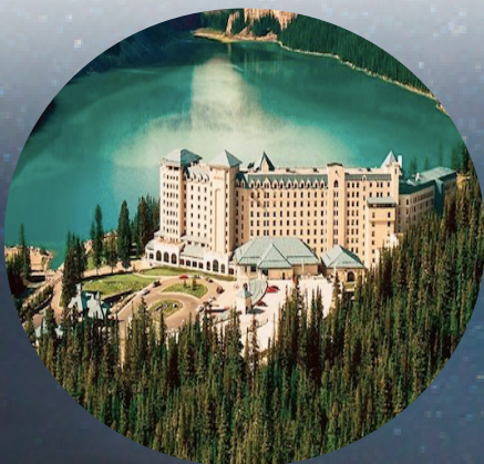
路易絲湖堡壘酒店

* 本公司之出發人數以不少於二十人為原則。如人數不足以成團, 本公司將於出發前7天退還所付之全部訂金或團費。